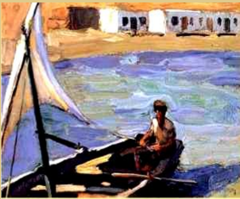
Νίκος Λύτρας, Βάρκα με πανί, Εθνική Πινακοθήκη.

βαίνει και σήμερα με τις Τεχνολογίες των Πληροφοριών και Επικοινωνιών (Τ.Π.Ε.), που ο κόσμος όλος είναι ένα χωριό (παγκόσμιο χωριό). Ο κοσμοπολιτισμός είναι αντίθετος με τον τοπικισμό και τον εθνικισμό. Αναφέρεται στον πολιτισμό όλου του κόσμου.