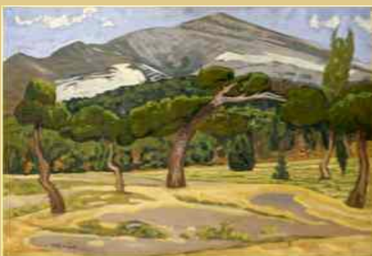
Κωνσταντίνος Μαλέας, Τοπίο Πεντέλης, Εθνική Πινακοθήκη

«Οι κάτοικοι του ελληνικού χώρου είτε το έχουν συνειδητοποιήσει είτε όχι, έχουν το προνόμιο να κάθονται,