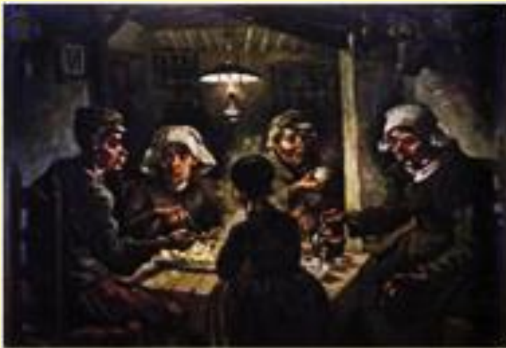
Βίνσεντ Βαν Γκογκ, Οι πατατοφάγοι, Van Gogh Museum.

Τα παιδιά χρειάζεται από μικρά να συνηθίζουν στην αποταμίευση, να αποκτούν καταναλωτική συνείδηση, να προσαρμόζονται στις δύσκολες καταστάσεις, αλλά και οι γονείς να αποτελούν παράδειγμα προς μίμηση. Αν λοιπόν συμβαίνουν όλα αυτά, μάλλον δεν θα υπάρξει πρόβλημα στην ορθή διαχείριση του οικογενειακού προϋπολογισμού.