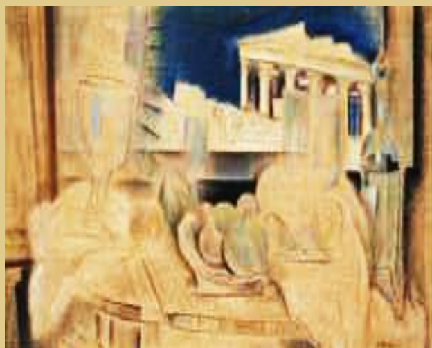
Κωνσταντίνος Παρθένης, Νεκρή φύση με την Ακρόπολη στο βάθος, Εθνι- κή Πινακοθήκη.

Συνεχίζουμε το όνομα ενός άνι- σου τόπου, που υπάρχει πολύ περισ- σότερο στο χρόνο παρά στο χώρο, και γι' αυτό η μοίρα μας δεν καταλα- βαίνει τη μοίρα των λαών του χώρου, αλλά κλώθεται ολοένα τριγύρω στο άλυτο πρόβλημα των δύο διαστάσε- ων. Είμαστε οι μνηστήρες του χρό- νου και οι καταδικασμένοι του χώ- ρου». (Ζήσιμος Λορεντζάτος, Μελέ- τες, εκδ. Γαλαξίας, Αθήνα 1967, σελ. 17)