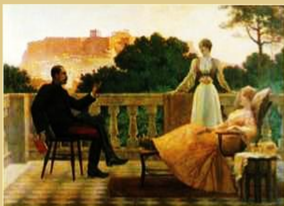
Ιάκωβος Ρίζος, Στην τανάτσα, Εθνική Πινακοθήκη.

Η διατήρηση της παράδοσης, ίσως σημαίνει προσκόλληση στο παρελθόν και αδυναμία παρακολούθησης της πορείας προς το μέλλον. Αλλά στην προκειμένη περίπτωση δε γίνεται λόγος για προσκόλληση στην παράδοση, ούτε για σύγκρουση με τις άλλες παραδόσεις. Άλλωστε, η πορεία προς το μέλλον, επιβάλλει και την πορεία προς το παρελθόν, για να διατηρείται η ισορροπία στο παρόν, όπως επιβάλλει και την αναγκαιότητα και την ωφελιμότητα της συνύπαρξης των διαφορετικών παραδόσεων.