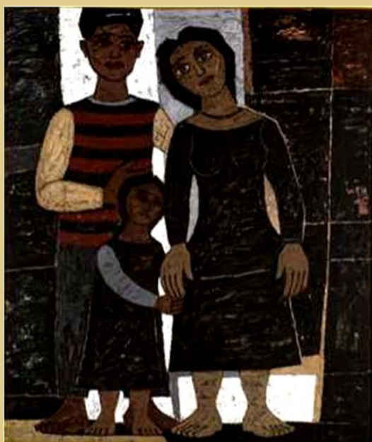
Γ. Σικελιώτης, Οικογένεια, π.1961-70, Εθνική Πινακοθήκη.

τονίζουν πως ο άνθρωπος είναι παμφάγος ζωντανός οργανισμός, έτσι όμοια κυριαρχείται από ένα πλήθος όχι αναγκαίως αλληλοεναρμονισμένων επιθυμιών, με αποτέλεσμα δύσκολα να μπορεί να διαψευστεί πως στον ερωτικό τομέα ο άνθρωπος είναι πολυγαμική ύπαρξη». (Κώστας Ε. Μπέης)