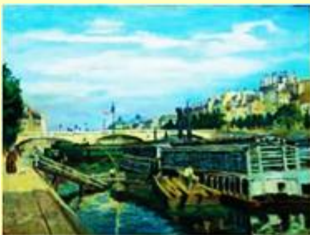
Αρμάν Γκιγιωμίν, Η γέφυρα του Λουίζ Φιλίπ, 1875, National Gallery of Art, Washington.

Όλοι οι δημόσιοι φορείς δρουν με βάση το γενικό ή το δημόσιο συμφέρον, ενώ οι επιχειρήσεις και τα νοικοκυριά δρουν με βάση το ιδιωτικό συμφέρον. Σκοπός του κράτους, όλων των δημόσιων φορέων, είναι η μεγιστοποίηση της κοινωνικής ευημερίας.