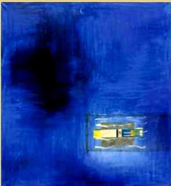
Ε. Τέρφλοθ, Ταξίδι στην Ελλάδα, 1973, Εθνική Πινακοθήκη.

Αξίζει να προσπαθεί κανείς για μια καλύτερη ζωή για όλους τους ανθρώπους στον πλανήτη Γη.