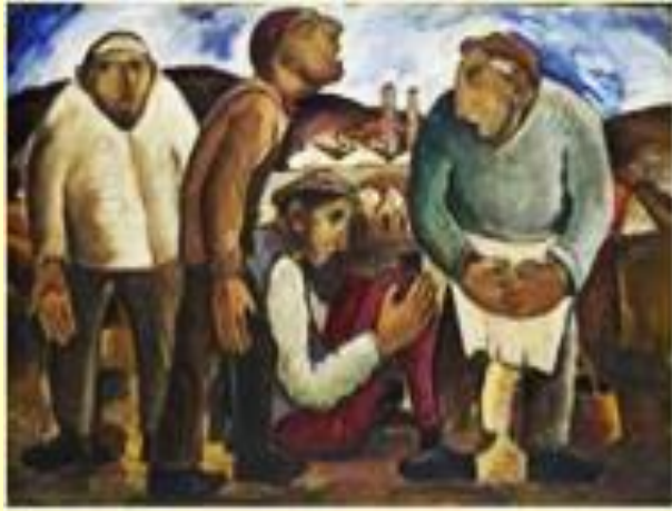
Γιώργος Σικελιώτης, Εργάτες, Εθνική Πινακοθήκη.

των κρατών απαιτεί γνώση, δημιουργικότητα και καινοτομία.