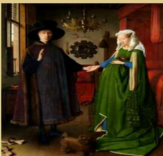
Γιαν Βαν Άικ, Ο Γάμος των Αρνοφίλνι, Εθνική Πινακο- θήκη Λονδίνου.

β) Με το διαζύγιο. Το διαζύγιο αλ- λάζει μορφή στην πυρηνική οικο- γένεια και την μετατρέπει σε μονο- γονεϊκή. Το διαζύγιο αλλάζει τη μορφή της οικογένειας, αλλά δε ση- μαίνει ότι ο θεσμός της οικογένειας παύει να υπάρχει.