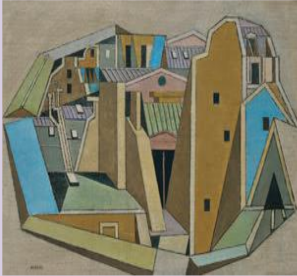
Νίκος Χατζηκυριάκος Γκίκας, Παρι- σινές στέγες, 1952, Εθνική Πινακοθήκη.

Τα Όργανα της δημοτικής κοινότητας είναι: