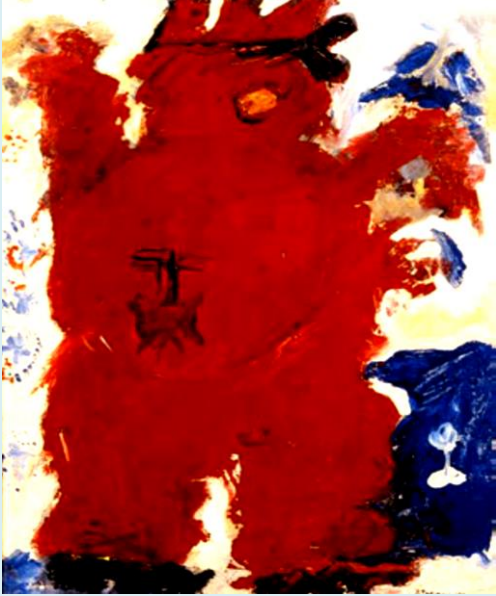
Αλέκος Φασιανός, Η κόκκινη φιγούρα, Εθνική Πινακοθήκη.

«Ας μην ομιλώμεν κατά των πολιτικών κομμάτων. Να ευχόμεθα όπως τα πολιτικά κόμματα να ευτηχήσουν να ανεύρουν ηγέτας, οι οποίοι γνωρίζουν ότι έρχονται εις την εξουσίαν διά του κόμματός των, αλλά ότι έρχονται εις την εξουσίαν αποφασισμένοι να μην γίνουν όργανα του κόμματος αυτών, θυσιάζοντες το γενικόν συμφέρον δια το συμφέρον του κόμματός των» (Ελευθέριος Βενιζέλος, βλέπε, Ρωμαίος Γ., άρθρο, Εφ. Το Βήμα, 8 Νοεμβρίου 2009).