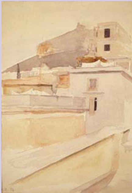
Ανδρέας Βουρλούμης, Αθηναϊκά σπίτια και ο Λυκαβηττός, 1952, Εθνική Πινακοθήκη.

πικής κοινότητας, τουλάχιστον μια φορά κατ' έτος σε συνέλευση, και προτείνουν στα αρμόδια όργανα του δήμου, ανάλογα με τον χαρακτήρα των αναγκών των κατοίκων της τοπικής κοινότητας και τις προτεραιότητες για την τοπική ανάπτυξη, τις δράσεις που πρέπει να αναλάβει ο δήμος.