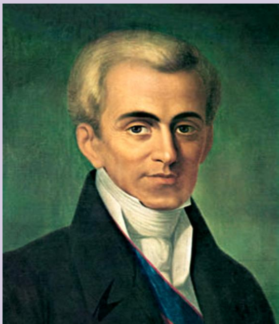
Ιωάννης Καποδίστριας (1776 - 1831)

«Κι αν γίνει δεκτό ότι το Ρωμαϊκό δίκαιο και η χριστιανική θρησκεία στηρίχθηκαν στο ελληνικό πνεύμα, τότε «είτε το συνειδητοποιείτε, είτε όχι, όλοι σας, φίλοι των χωρών της Ευρώπης, γεννηθήκατε στην Ελλάδα. Οι πολιτισμικές και οι άλλες αξίες σας, οι πολιτικοί ακόμα θεσμοί σας είναι ελληνοκεντρικοί». (Αντώνης Τρίτσης)