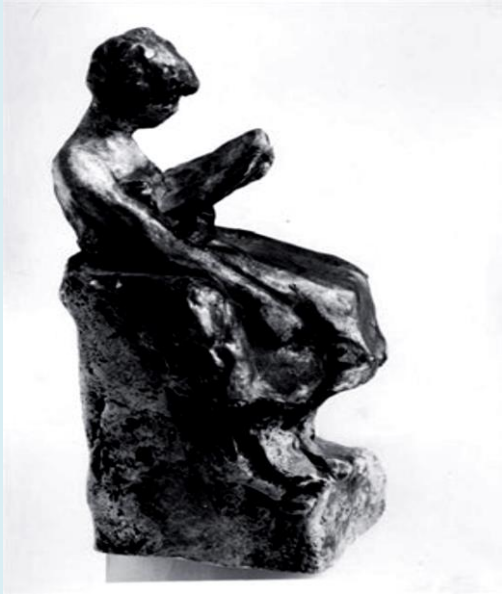
Γύζης Νικόλαος, Κορίτσι που δια- βάζει, 1898, Εθνική Πινακοθήκη.

Κάθε ομάδα ή κοινωνία δεν αναμένει από όλα τα μέλη της ακριβώς ίδια, δηλαδή τυποποιημένη συμπεριφορά, αλλά μια συμπεριφορά που πρέπει να κινείται σε ορισμένα όρια. Επιτρέπεται λοιπόν η διαφορετική συμπεριφορά (συμπεριφορά εντός ορίων), αλλά δεν επιτρέπεται η παρεκκλίνουσα συμπεριφορά (συμπεριφορά εκτός ορίων). Η παρέκκλιση δεν ορίζεται από το είδος της συμπεριφοράς, αλλά από την αντίδραση του κοινωνικού συ-