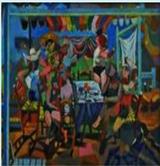
Νίκος Χατζηκυριάκος - Γκίκας, Γλέντι στο ακρογιάλι, 1931, Εθνική Πινακοθήκη.

ΤΟΥΝΤΟΣ ΚΟΙΝΩΝΙΚΟ-ΠΟΛΙΤΙΚΟΥ ΣΥΣΤΗΜΑΤΟΣ. Έτσι π.χ. ένα αυταρχικό σύστημα μέσω της πολιτικοποίησης επιδιώκει διαφορετικούς στόχους σε σύγκριση με ένα δημοκρατικό σύστημα. Το αυταρχικό σύστημα φοβάται τη συμμετοχή του πολίτη, ενώ το δημοκρατικό σύστημα την επιδιώκει. Και όσον αφορά τη συμμετοχή του πολίτη, η πολιτεία δεν μπορεί να σταθεί χωρίς τη συμμετοχή των πολιτών της.