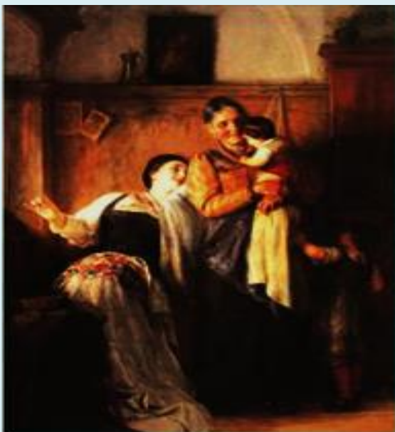
Νικόλαος Γύζης, Κούκου, 1882, Ε- θνική Πινακοθήκη.

«Καμμιά φορά κλαίω γιατί με πονάει το να είμαι μοναχικός. Αλήθεια πονάει. Για να είμαι ειλικρινής αυτό που με πονάει πραγματικά είναι το να είμαι εγώ». (Μάικλ Τζάκσον, Τραγουδιστής) Μια ομολογία συγκλονιστική!