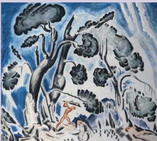
Κωνσταντίνος Παρθένης, Ο Ηρακλής και οι Αμαζόνες, π. 1922, Εθνική Πινακοθήκη.

τοποιεΐ. Είναι ή νοιώθει ανίκα- νος να συμμετέχει, από τα πιο μικρά έως τα πιο μεγάλα. Μια πολιτεΐα, όταν απέχουν οι πολί- τες από τα κοινά, είναι επόμενο να διέρχεται κρίση. Κρίση νομι- μοποίησης, η οποία οδηγεί στην ανάγκη και στο αίτημα για τη συμμετοχή του πολίτη. Η πολι- τεΐα πλέον οφείλει να παρέχει πολιτική παιδεία, να εκπαιδεύει τον πολίτη, ώστε να γίνει ικανός να συμμετέχει ελεύθερα και υ- πεύθυνα στα κοινά.