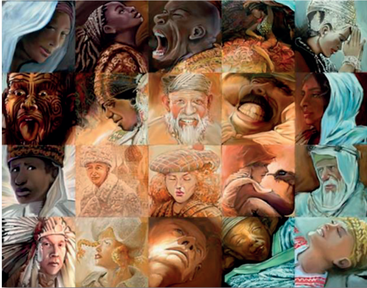
Lavoie, Lewis, Adam. One Blood, Many Nations. (mural mosaic)