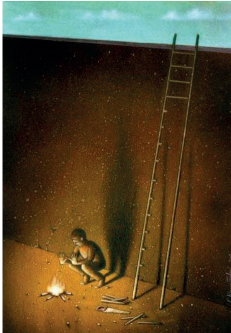
Pawel Kuczynski, Ladder