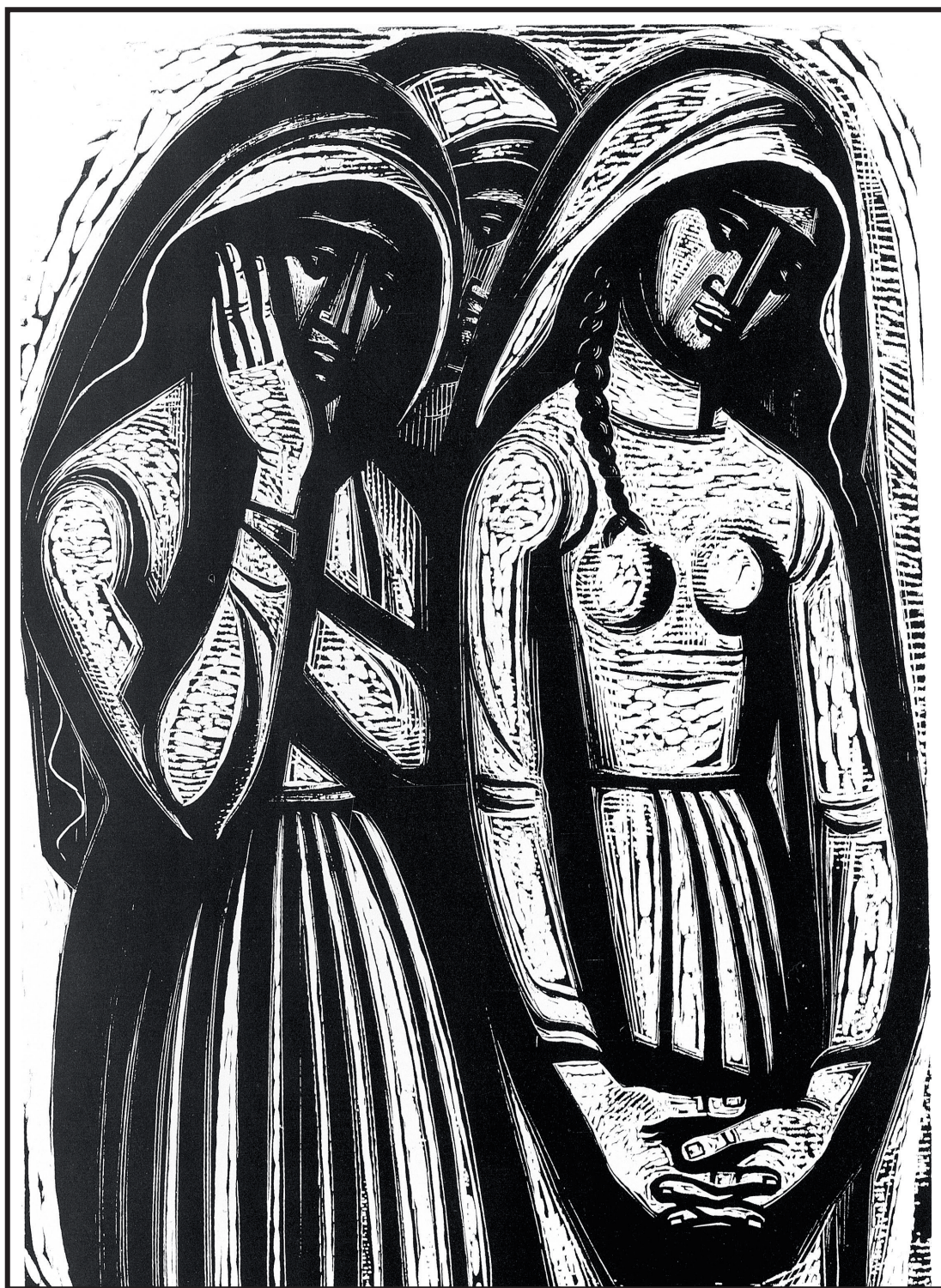
Τάσσος, «Λεπτομέρεια Εμφυλίου Πολέμου. Οι Γυναίκες», 1962 (Συλλογή Εθνικής Τράπεζας)