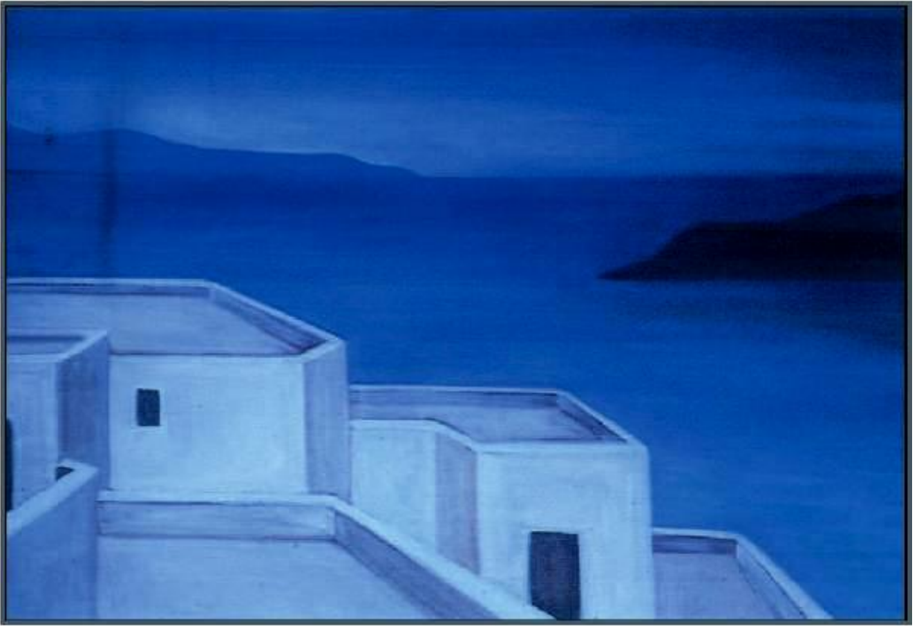
Γιούλικα Λακερίδου, Αιγαίο, 1989. Ελαιογραφία σε μουσαμά. Ιδιωτική Συλλογή.