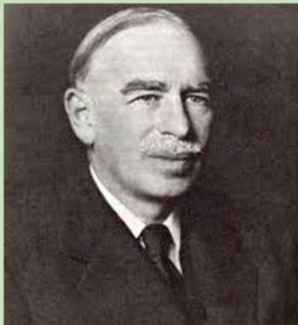
Τζων Μέυναρντ Κέυνς, διαπρεπής Άγγλος οικονομολόγος

Οι ακραιφνείς θιασώτες, είτε της ιδιωτικής πρωτοβουλίας είτε του κρατικού παρεμβατισμού, είναι δεσμιοι της λογικής που οδηγεί στο «δίλημμα των φυλακισμένων», δηλαδή: αγορά και κράτος, σκεφτόμενοι «ατομικά», οδηγούνται σε δυσμενέστερη κατάσταση. Ενώ αν μπορούσαν να συνεννοηθούν και να συνεργαστούν, η δράση τους θα ήταν προς όφελος τόσο της αγοράς (των ιδιωτών) όσο και του κράτους (του κοινωνικού συνόλου).