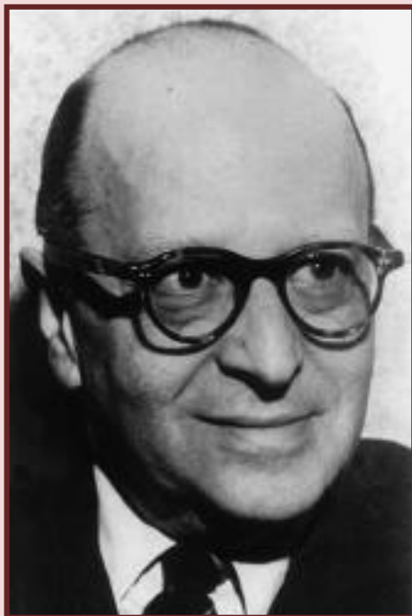
Μαξ Χορκχάιμερ (1895-1973) Γερμανός Φιλόσοφος