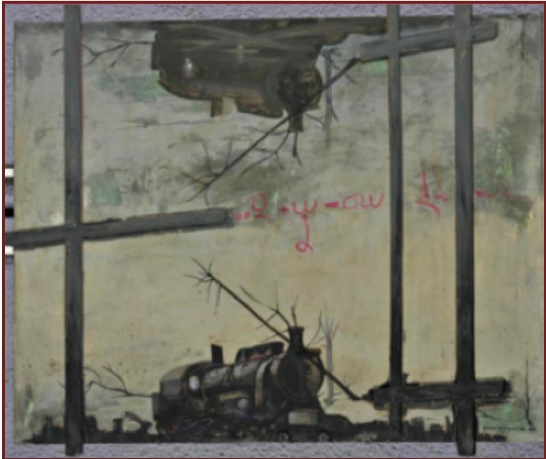
Στέλιος Μαυρομάτης, Σύνθεση, 1983, Εθνική Πινακοθήκη