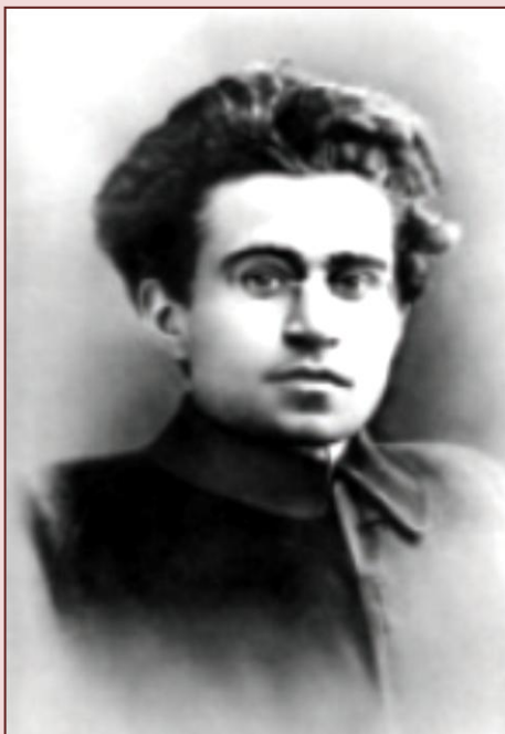
Αντόνιο Γκράμσι (Antonio Gramsci, 1891-1937)