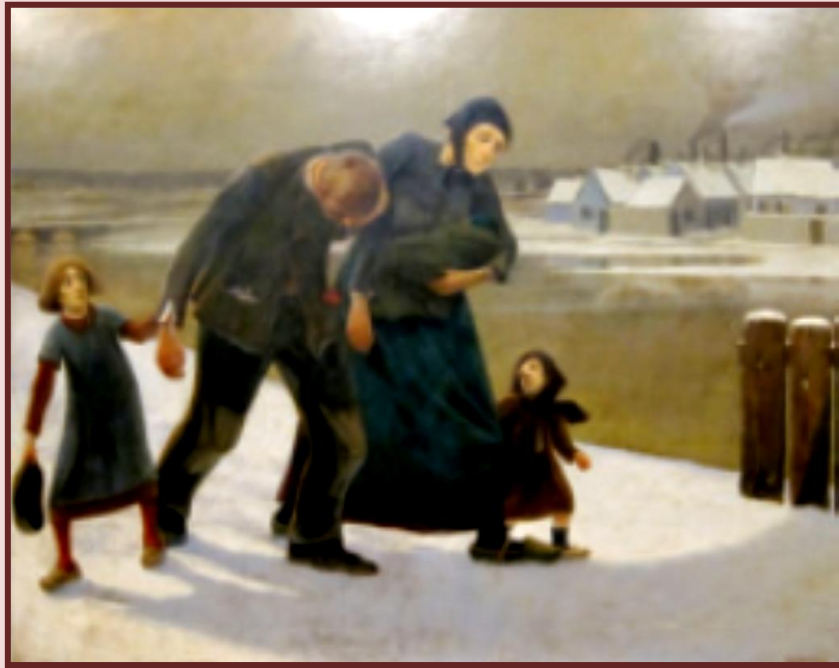
Ευγένιος Λεμάνς, Ο μέθυσος, Βασιλικό Μουσείο Καλών Τεχνών, Βρυξέλλες

σία) οδήγησαν τους σοσιαλιστές να αναζητήσουν μια καλύτερη κοινωνική οργάνωση που θα είναι απαλλαγμένη από αυτά τα προβλήματα.