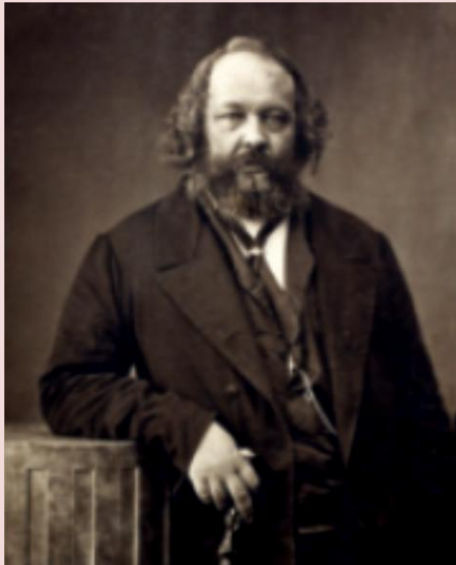
Μιχαήλ Μπακούνιν (1814-1876) Ρώσος αναρχικός

Ο Πέτρος Αλεξέγιεβιτς Κροπότ- κιν (1842-1921) ήταν Ρώσος θεωρη- τικός του αναρχισμού, ο οποίος προσπάθησε μέσα από τα γραπτά του να συστηματοποιήσει τον αναρ- χισμό ως φιλοσοφία και πολιτική θεωρία. Έζησε τα γεγονότα της Ρωσικής Επανάστασης του 1917. Παρά την αντίθεση αναρχικών-μαρ- ξιστών για το ζήτημα του κράτους, ο Κροπότκιν είδε θετικά τη Ρωσική Επανάσταση. Όμως, στην πορεία