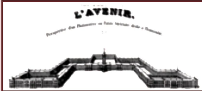
Σχέδιο ενός φαλανστηρίου

γωγή και θα εισπράττουν τα κέρδη της εργασίας τους.