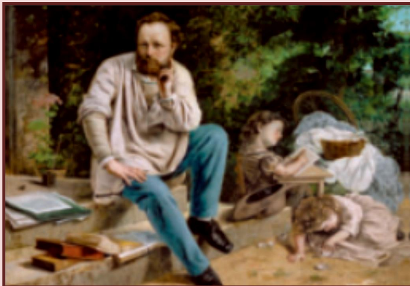
Γκυστάβ Κουρμπέ, Ο Προυντόν και τα παιδιά του, 1865

Οι ιδέες των Μαρξ και Ένγκελς βρίσκονταν στη βάση της Ρωσικής Επανάστασης του 1917 αλλά και σε άλλα εγχειρήματα οικοδόμησης του σοσιαλισμού (βλ. 2.4).