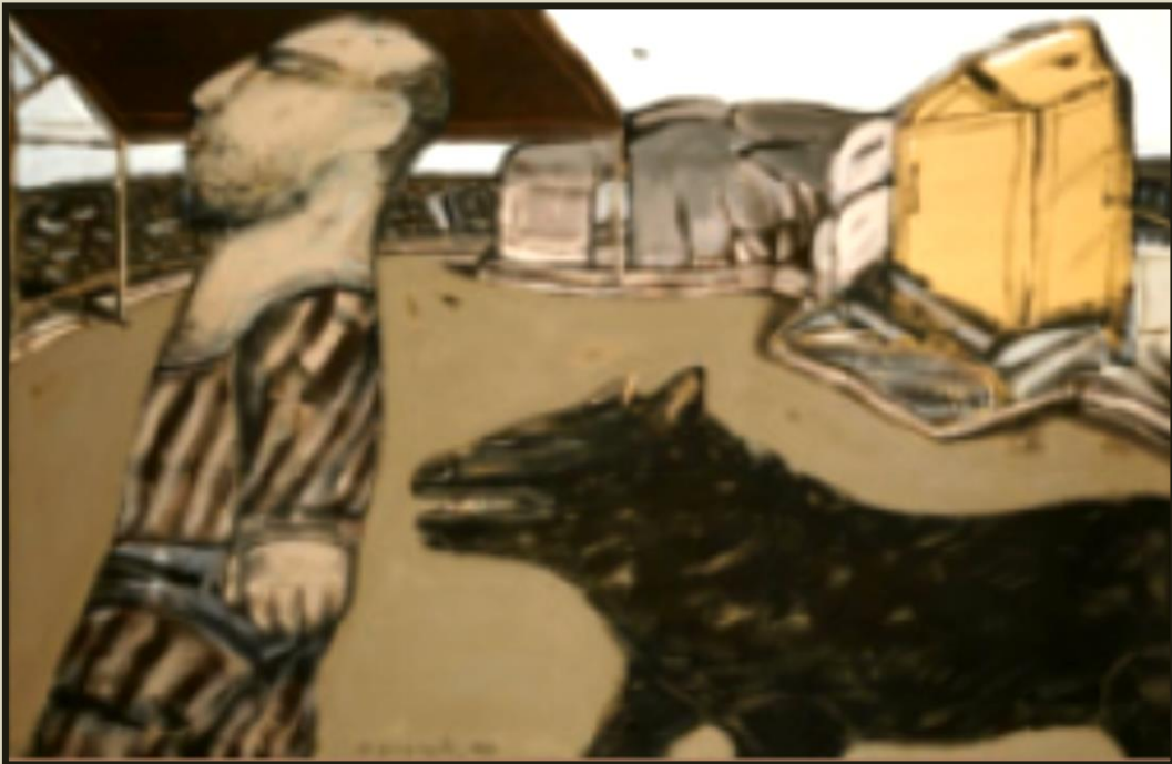
Νίκος Χουλιάρας, Ο ζωγράφος που φεύγει, 1940, Εθνική Πινακοθήκη

Ο όρος νομενκλατούρα προέρχεται από τη λατινική λέξη nomenclatura (κατάλογος ονομάτων). Ο όρος νομενκλατούρα χρησιμοποιείται στην πολιτική για να δηλώσει μια ομάδα ανθρώπων που κρατάει και ελέγχει, επί πολλά έτη, τις καίριες θέσεις σε ένα κόμμα, μια κυβέρνηση κτλ.