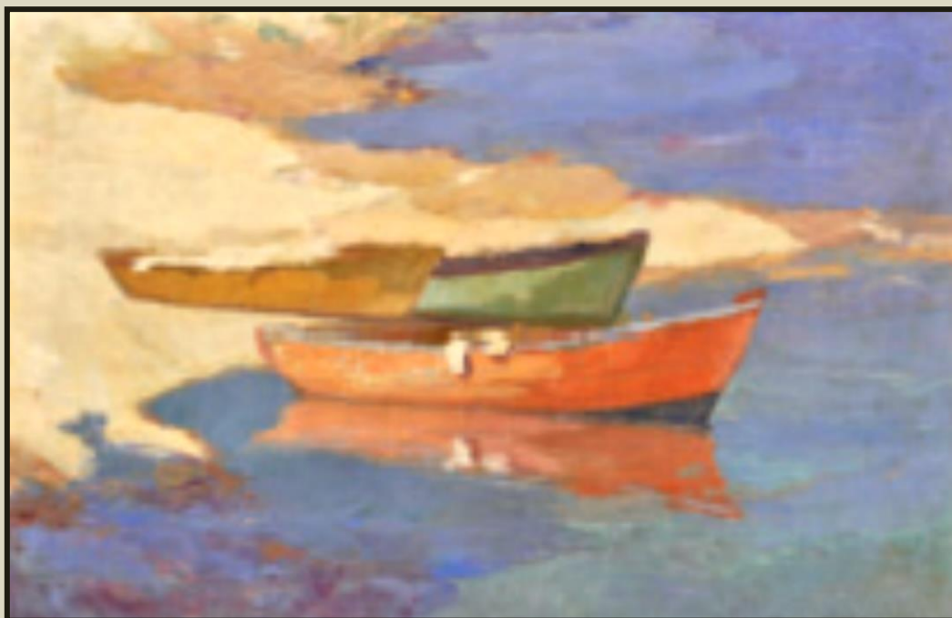
Μιχάλης Οικονόμου, Βάρκες, Εθνική Πινακοθήκη

Ο όρος κυβερνοχώρος σημαίνει έναν νέο «κοινωνικό» χώρο, ο οποίος διαμορφώνεται από το παγκόσμιο δίκτυο των υπολογιστών που συνθέτουν το διαδίκτυο. Οι άνθρωποι στον κυβερνοχώρο είναι μηνύματα στις οθόνες των υπολογιστών. Δεν υπάρχει η φυσική τους παρουσία. Όμως, αυτό δεν σημαί-