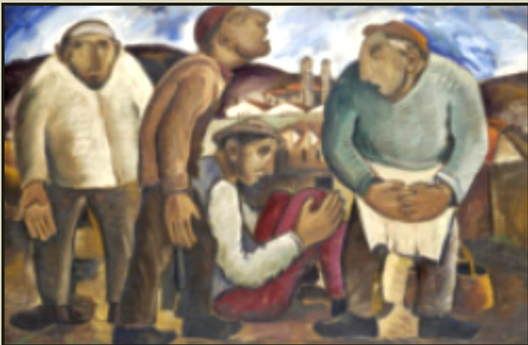
Γιώργος Σικελιώτης, Εργάτες, Εθνική Πινακοθήκη

ριθμός μεταναστών που μπήκαν στην «περιπέτεια» της μετανάστευσης επιθυμώντας να γνωρίσουν νέες περιοχές και ανθρώπους, να δοκιμάσουν την τύχη τους σε κάτι νέο και διαφορετικό από αυτό που ζούσαν στη χώρα τους.