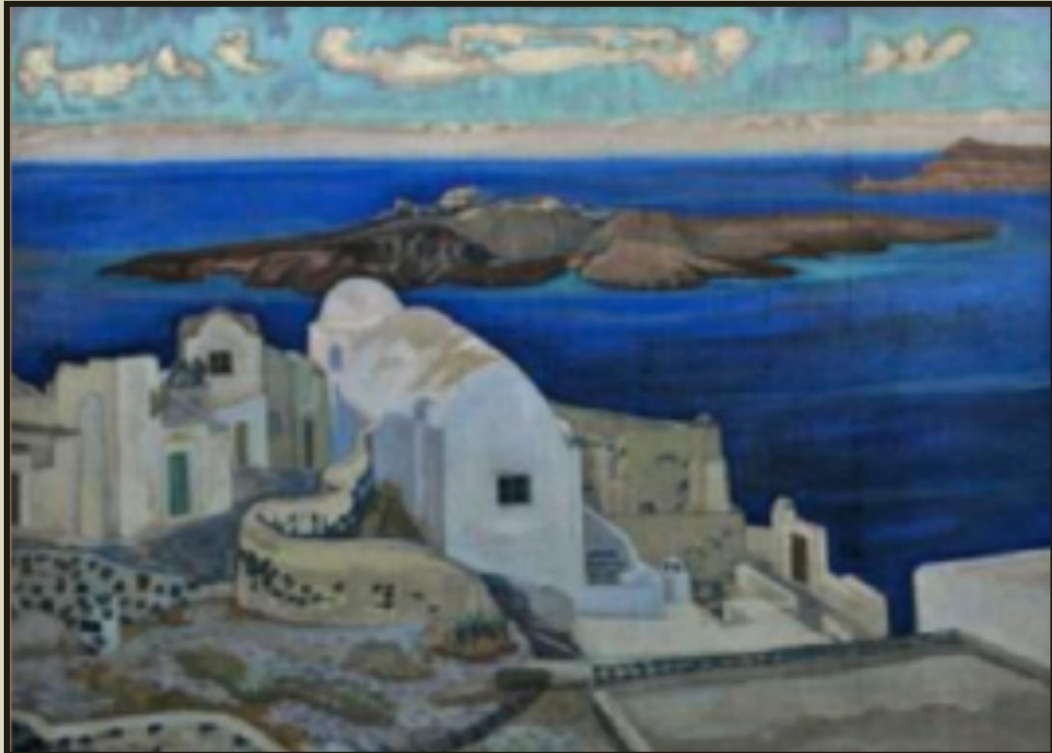
Κωνσταντίνος Μαλέας, Σαντορίνη, 1924-1928, Εθνική Πινακοθήκη