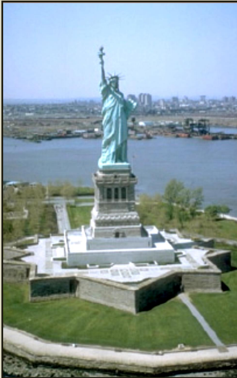
Το άγαλμα της Ελευθερίας, Νέα Υόρκη

Υπάρχουν πολλά σύμβολα της μετανάστευσης. Αγάλματα, λιμάνια, πόλεις που υποδέχθηκαν και υπο-