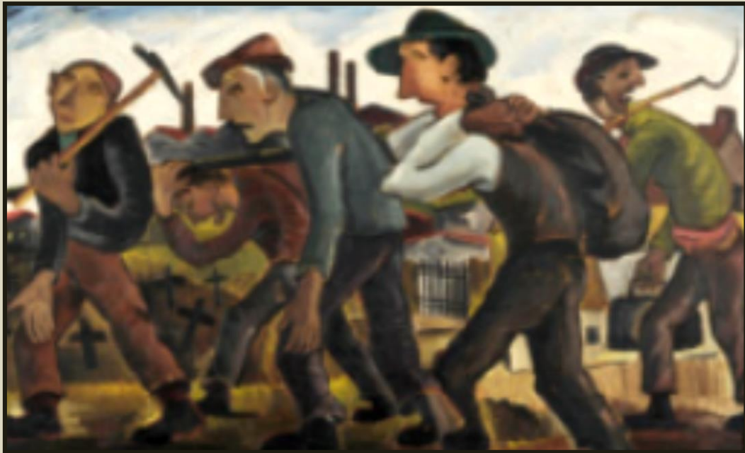
Γιώργος Σικελιώτης, Εργάτες, Εθνική Πινακοθήκη

Για τις παραδοσιακές χώρες υποδοχής μεταναστών, όπως υπήρξαν το 19ο αιώνα οι χώρες της αμερικάνικης ηπείρου και η Αυστραλία και τον 20ό η Αγγλία, η Γαλλία και η Γερμανία, το φαινόμενο της μετανάστευσης αποτέλεσε συστατικό στοιχείο της δομής των κοινωνιών τους και βασικός ρυθμιστής της σημερινής τους εικόνας και οργάνωσης.