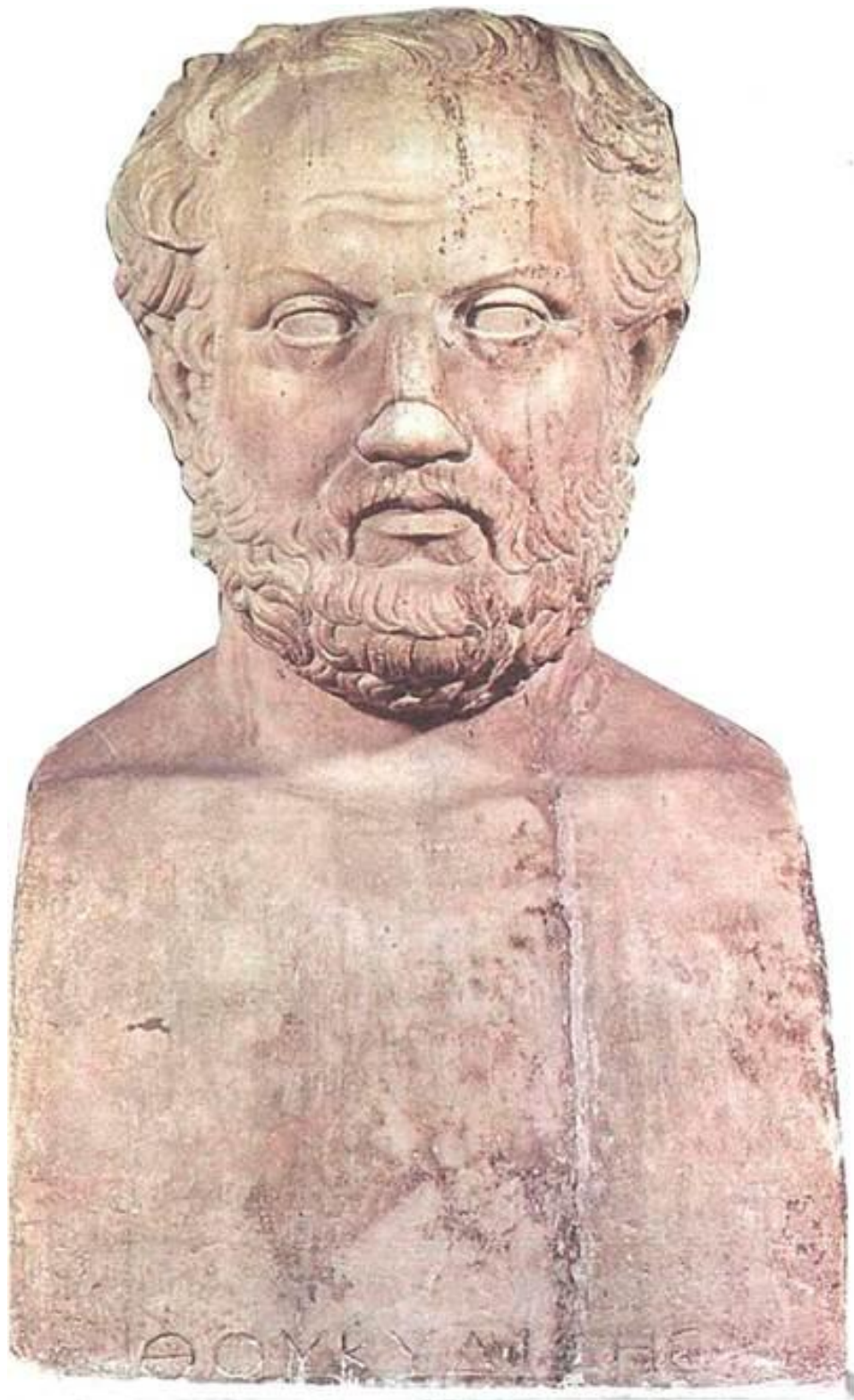
Θουκυδίδης Ὀλόρου Ἀλιμούσιος (460-400 π.Χ.) (Ρωμαϊκό αντίγραφο προτομής του 4ου π.Χ. αιώνα).