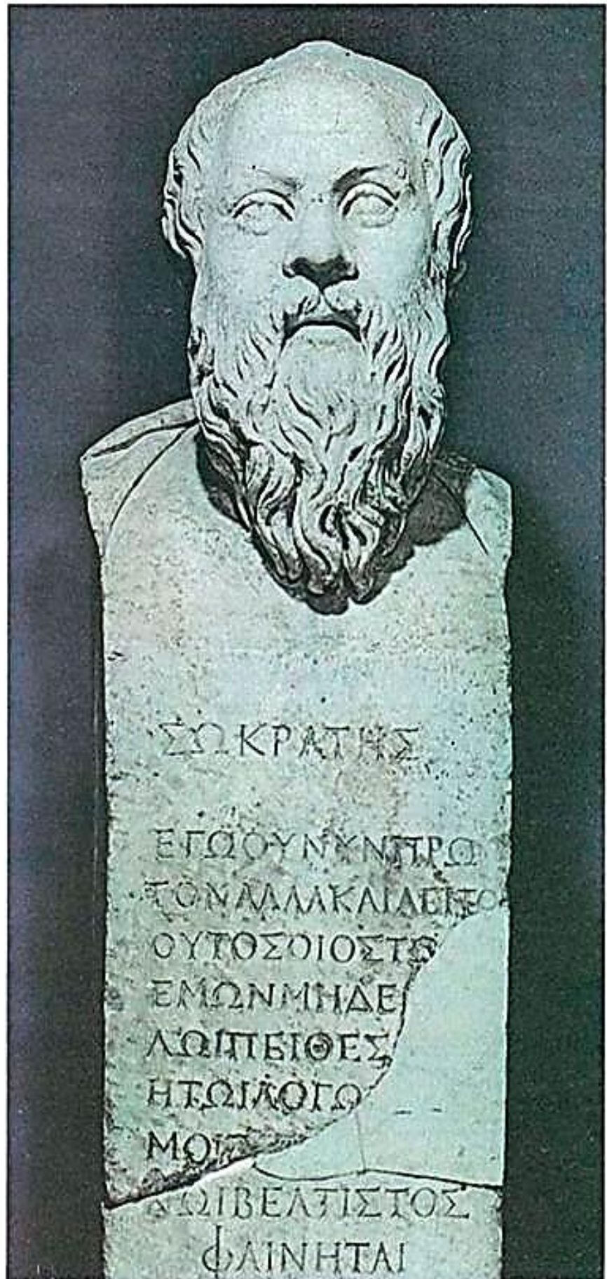
Προτομή του Σωκράτη. Ρωμαϊκό αντίγραφο έργου του 4ου αι.π.Χ. ( Μουσείο Βατικανού ).