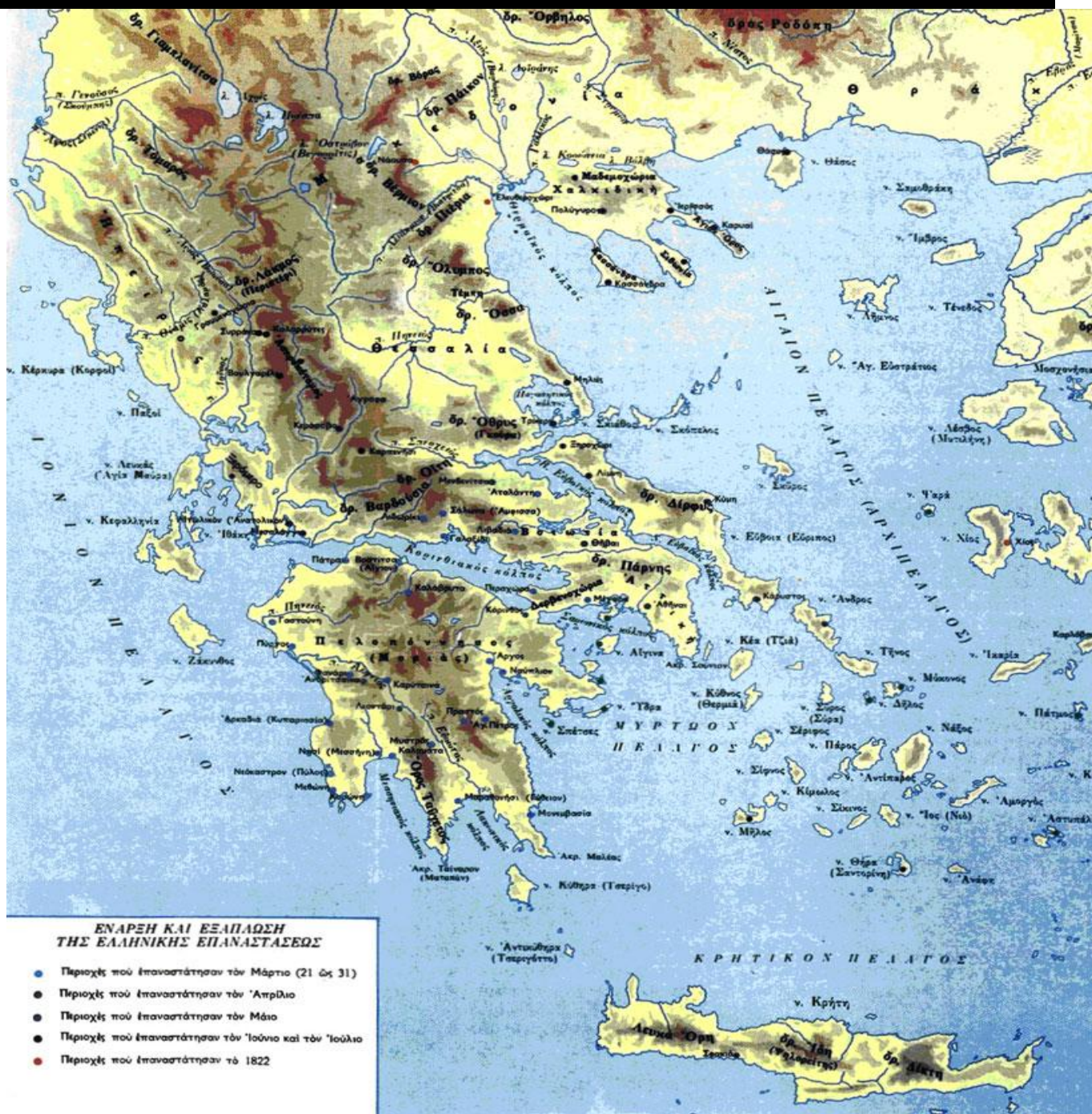
Χάρτης της Ελληνικής Επανάστασης