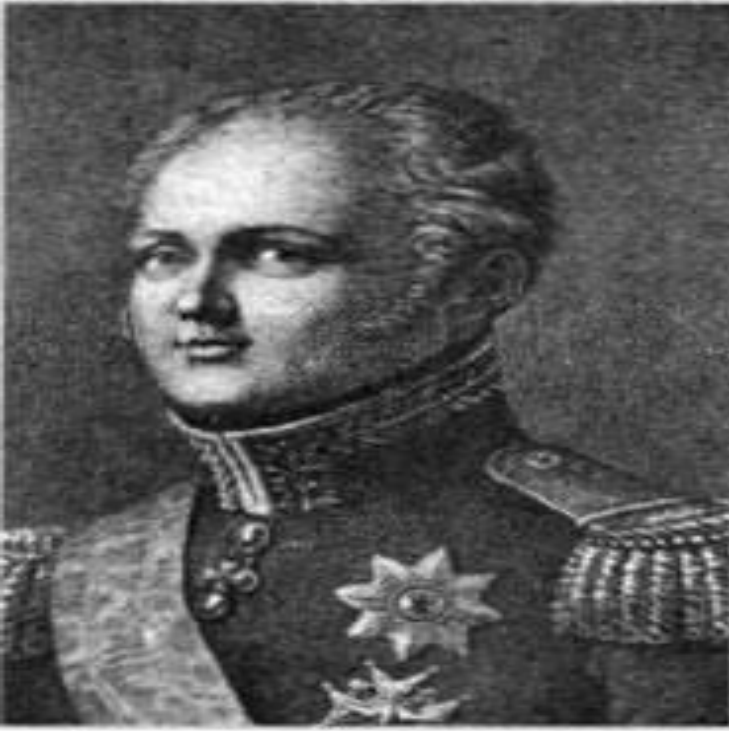
Ο τσάρος Αλέξανδρος Α'. Γεννάδειος Βιβλιοθήκη, Αθήνα.

«Ο τσάρος Αλέξανδρος Α' της Ρωσίας είχε ενθουσιαστεί με την ιδέα μιας χριστιανικής ένωσης της Ευρώπης και είχε πετύχει να πείσει, μετά το 1815, τους ηγεμόνες της Πρωσίας και της Αυστρίας, καθώς και τα περισσότερα κράτη να προσχωρήσουν σε μια "Ιερά Συμμαχία". Αυτή βασιζόταν "στην εμπιστο-