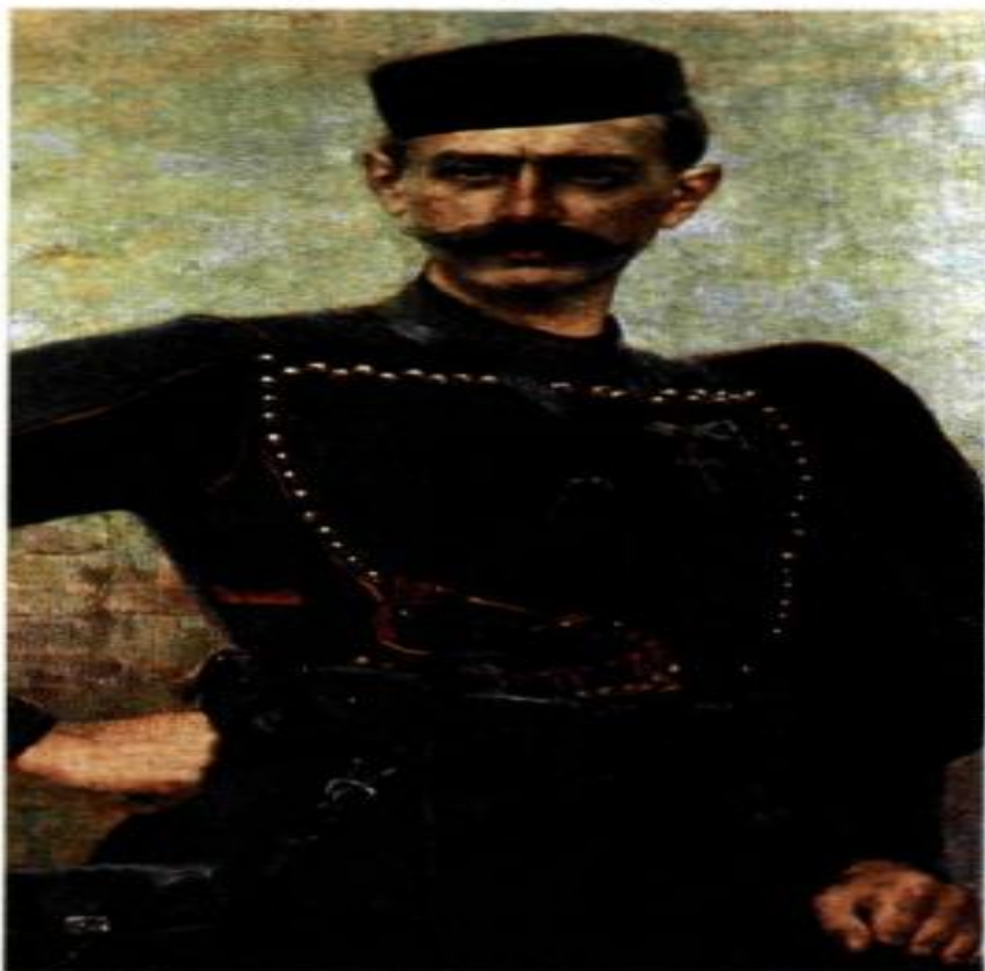
Ο Παύλος Μελάς (1870-1904),

που υπήρξε για τους Αλβανούς η μήτρα του εθνικού κινήματος και η αυτόκλητη αλλά αναπόφευκτη προστάτιδα του εθνικού κράτους των Αλβανών, το οποίο προέκυψε το 1913 από τους Βαλκανικούς Πολέμους (1912-1913).