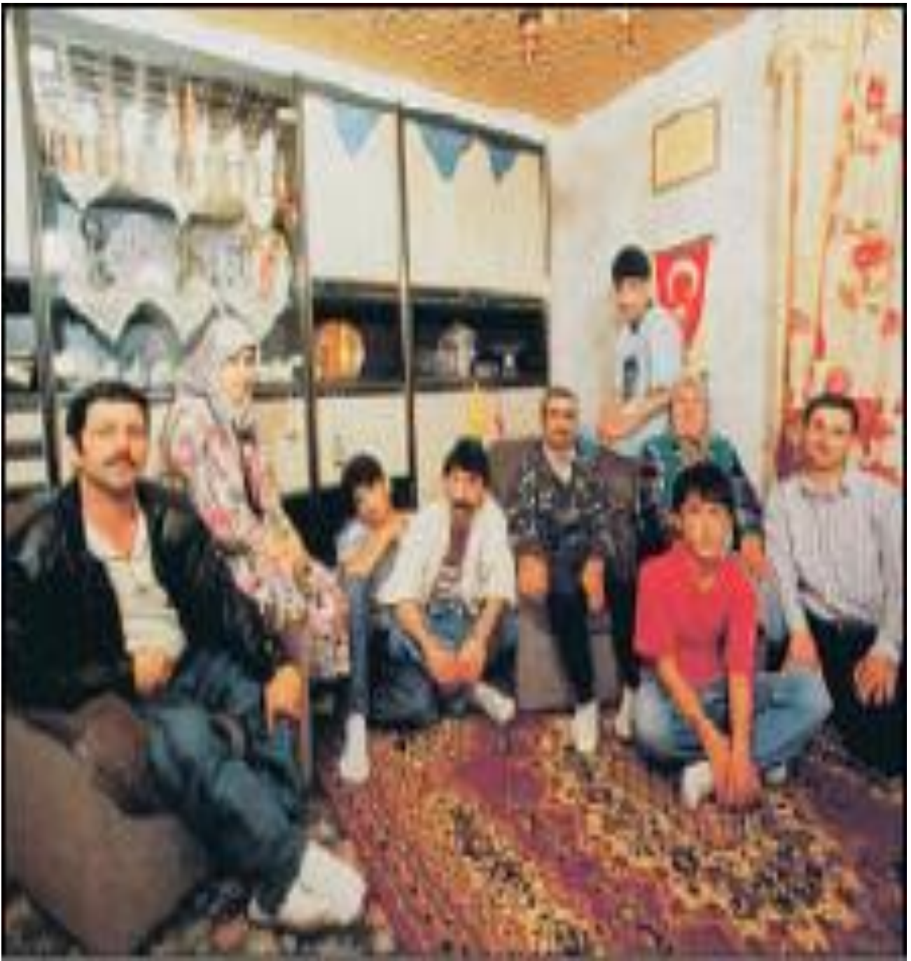
Εικ.4.5γ Τουρκία (M. Casta & P. Guizard, Histoire géographie éducation Civique, 4 e Éditions Magnard, 2004)