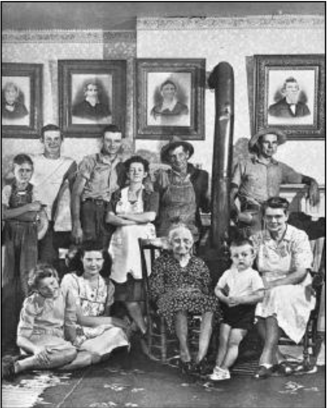
Εικ.4.5β Η.Π.Α: (E. Steichen, The family of man, 1955)