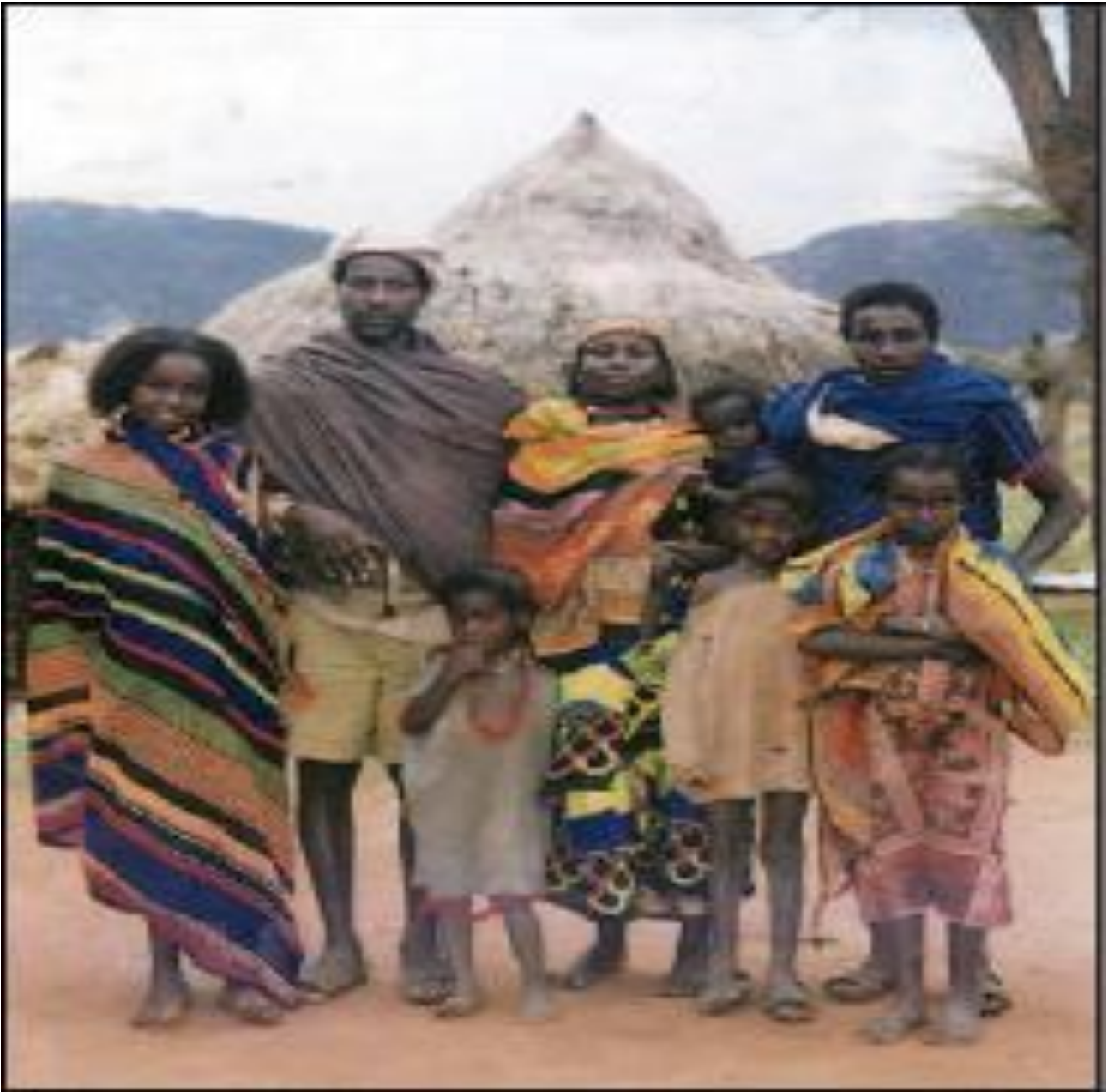
Εικ.4.6β Αιθιοπία