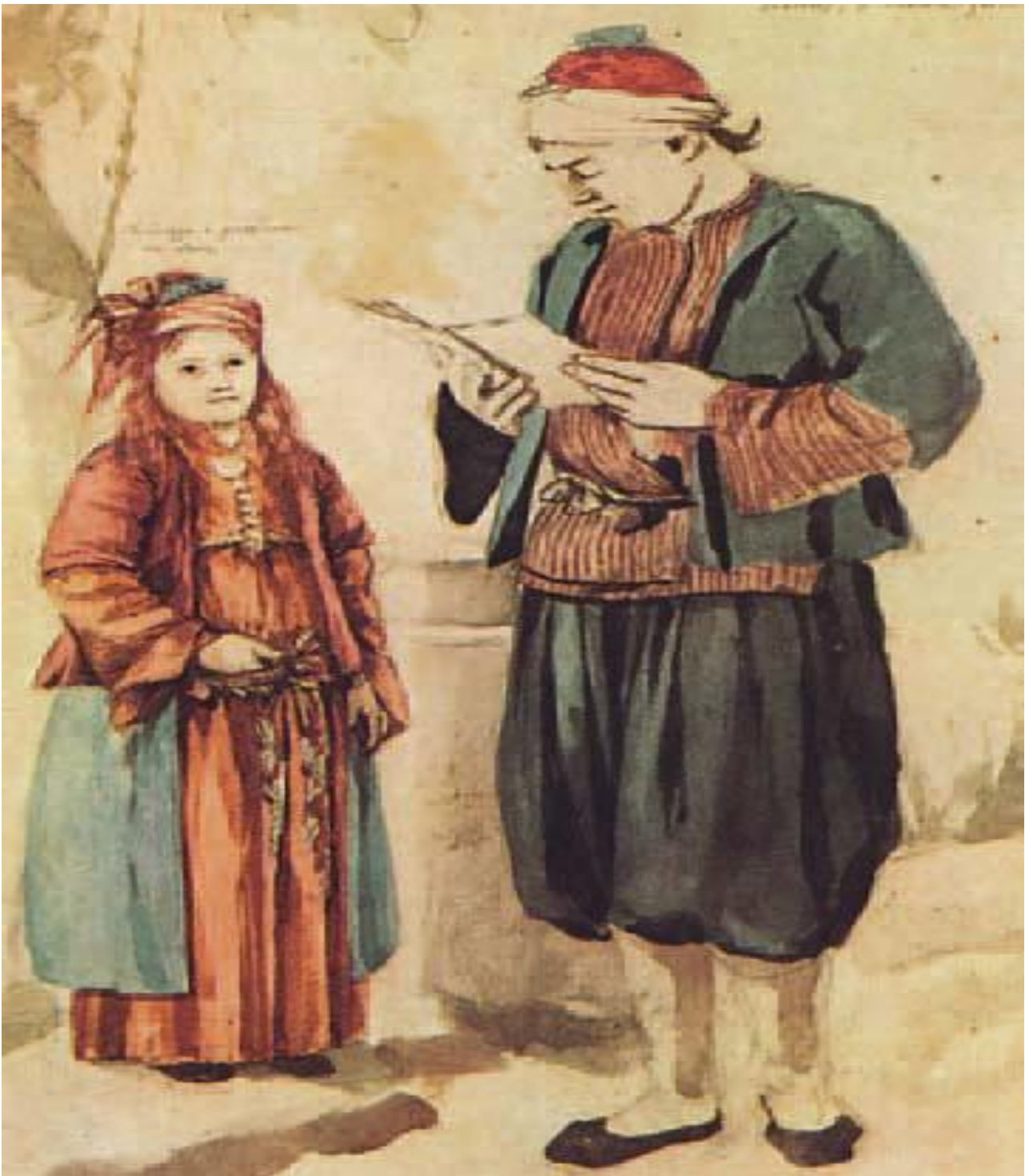
Εικ.5.3β Ιδιωτικός δάσκαλος διδάσκει Αθηναία (Ιστορία του Ελληνικού Έθνους, Εκδοτική Αθηνών, 1970).