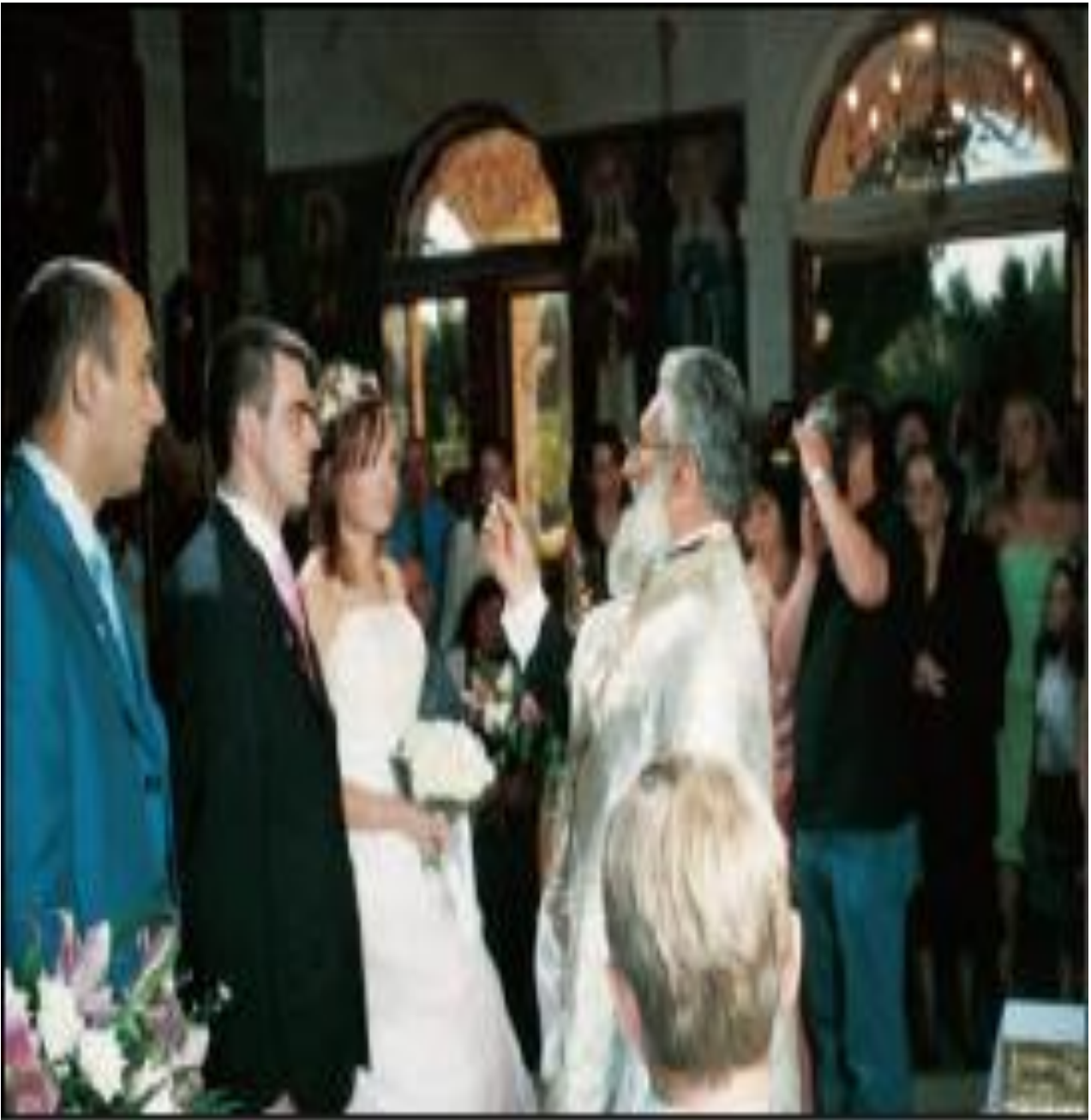
Εικ.4.2 Ελληνικοί γάμοι, 1880 και 2005 (Αθήνα 1839-1900: Φωτογραφικές μαρτυρίες, εκδ. Μουσείου Μπενάκη, 2003).