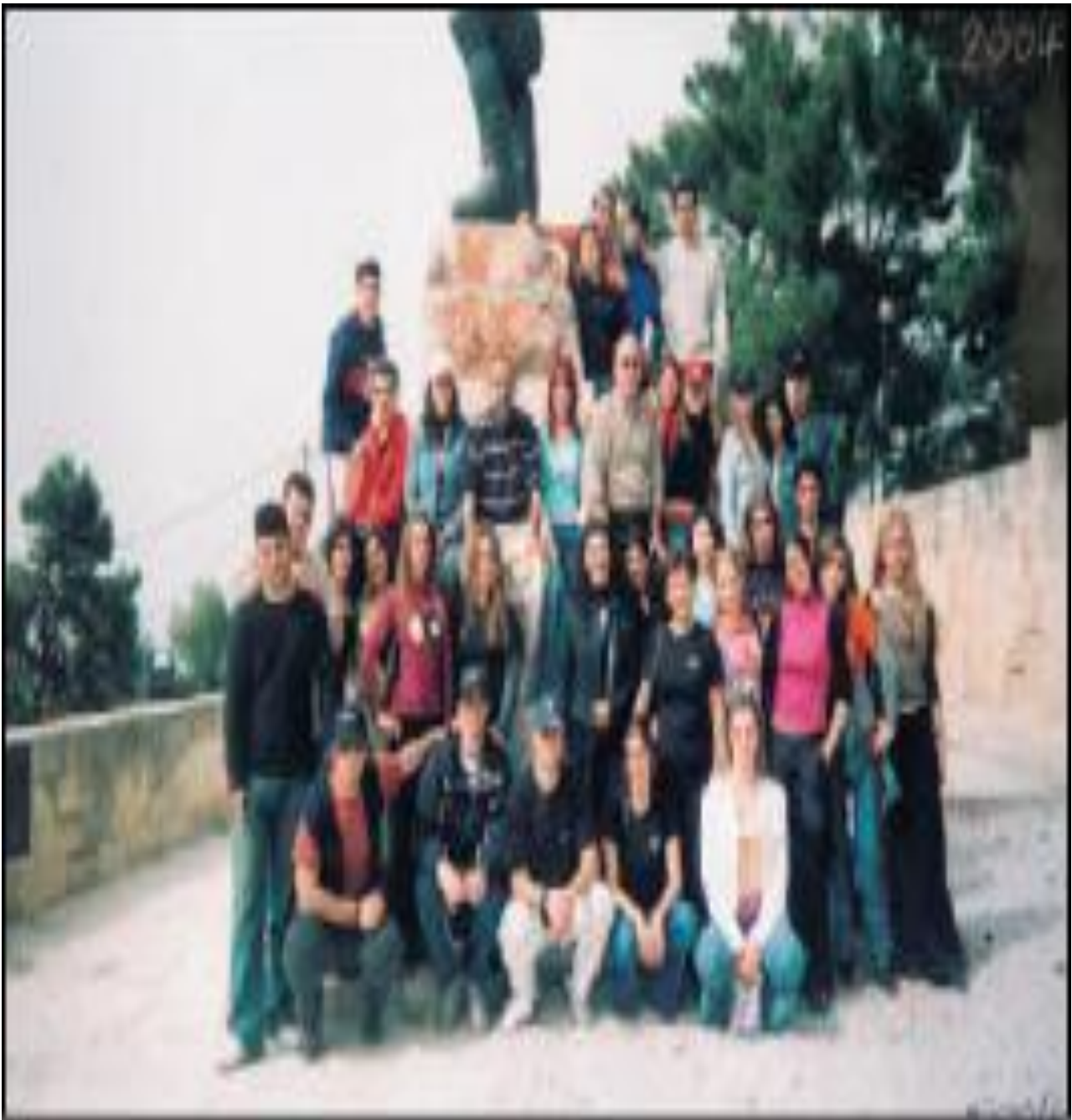
Εικ.5.1γ Γ Λυκείου, 2ο Λύκειο Δραπετσώνας, σχολική εκδρομή 2004.