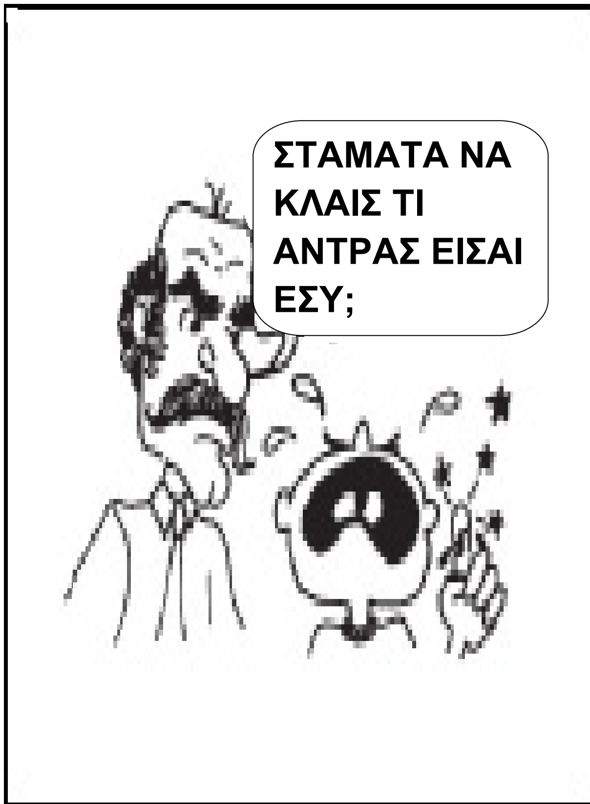
Εικ.4.10 Άτυπος κοινωνικός έλεγχος: το αγόρι μαθαίνει τι δε μπορεί να