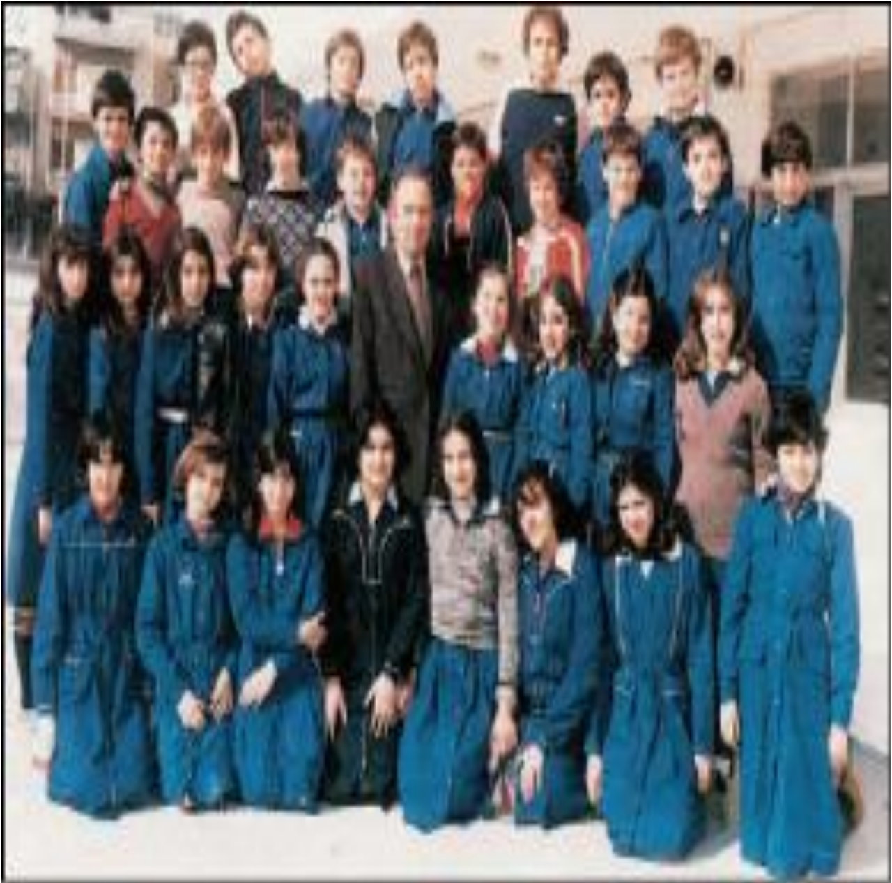
Εικ.5.1β Μαθητές στο προαύλιο του σχολείου τους κατά το σχολικό έτος 1981-82 (Ιστορία του Νέου Ελληνισμού, τόμος 10, τεύχος 11, εκδ. Ελληνικά Γράμματα).