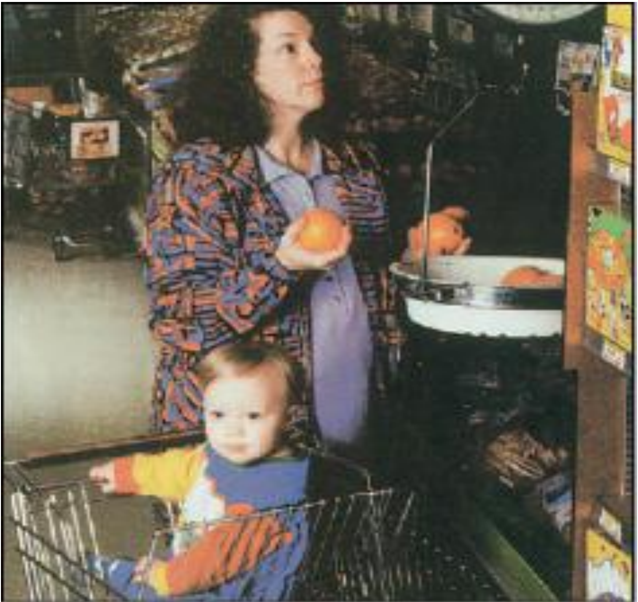
Εικ.4.7 Μονογονεϊκή οικογένεια (Εγκυκλοπαίδεια Grand Larousse, Ενότητα III: Γενικές επιστήμες έμβιος κόσμος, εκδ. Ελληνικά Γράμματα, 2001