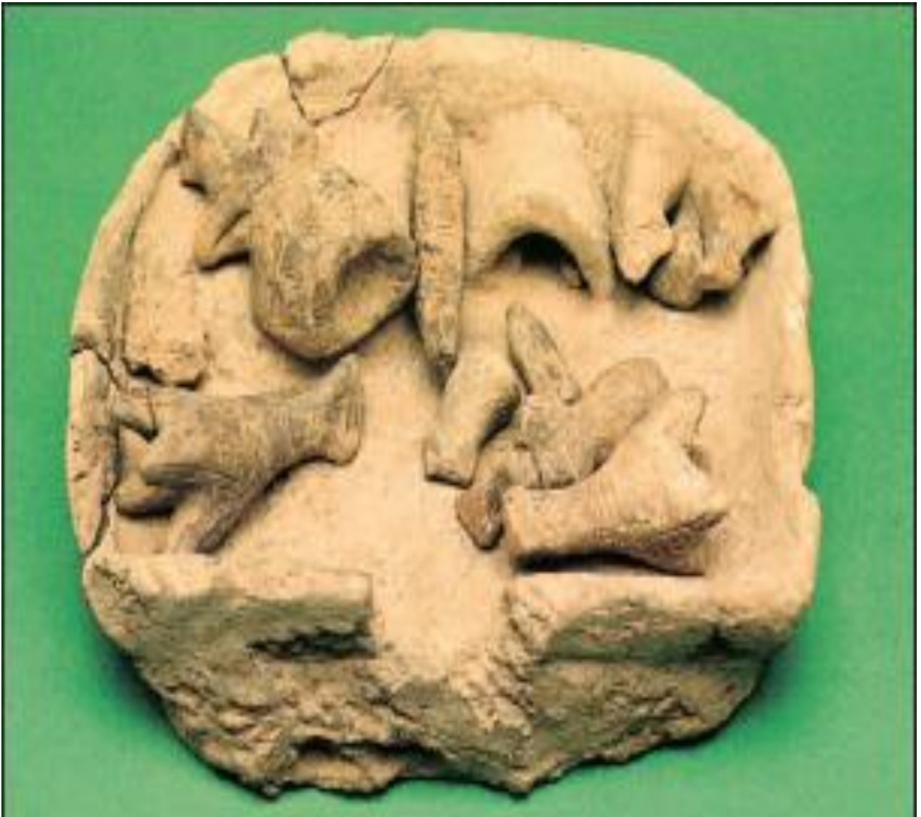
Εικ.4.4 Ομοίωμα σπιτιού νεότερης νεολιθικής εποχής, που απεικονίζει το εσωτερικό του και τα μέλη μιας εκτεταμένης οικογένειας (ΙΕ' Εφορεία Προϊστορικών και Κλασικών Αρχαιοτήτων Λάρισας)