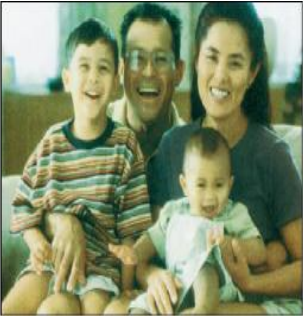
Εικ.4.6γ Η.Π.Α (J.Shepard&R.Green Sociology and you, National Text book Company, Edition 2004).