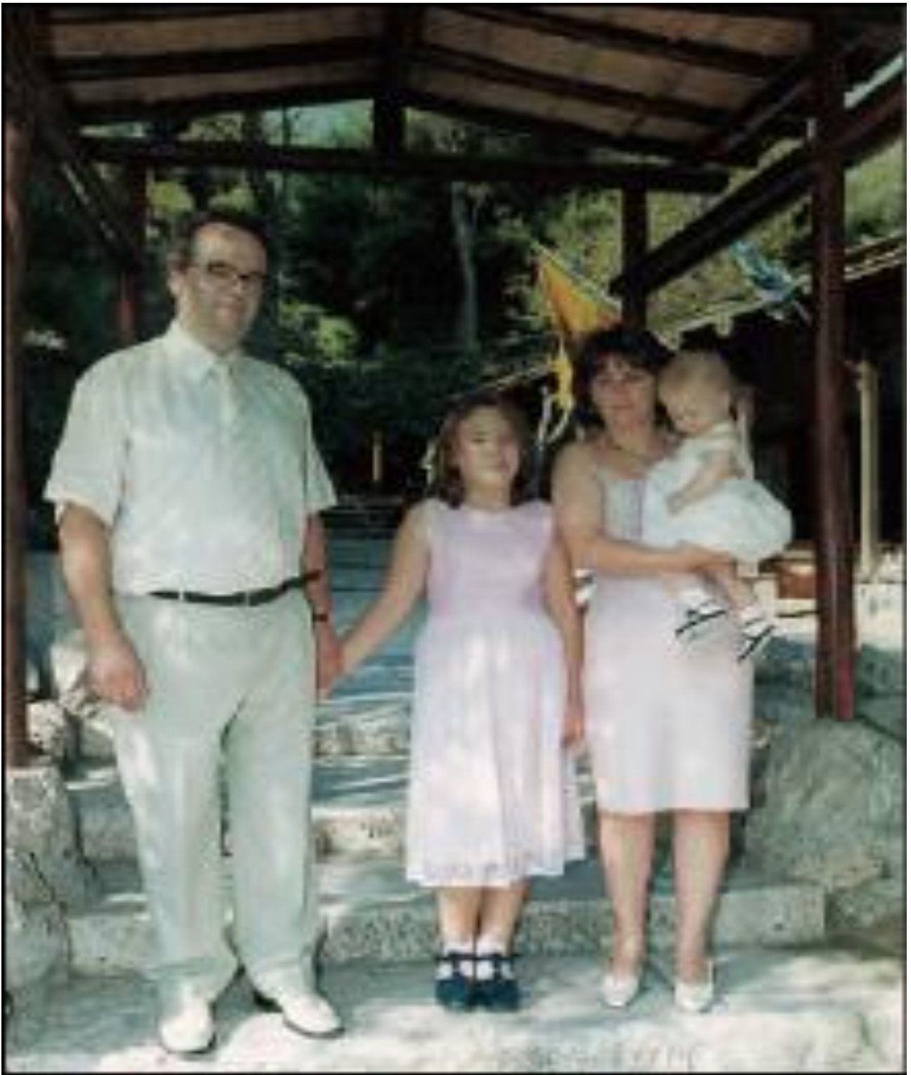
Εικ.4.6α Ελλάδα