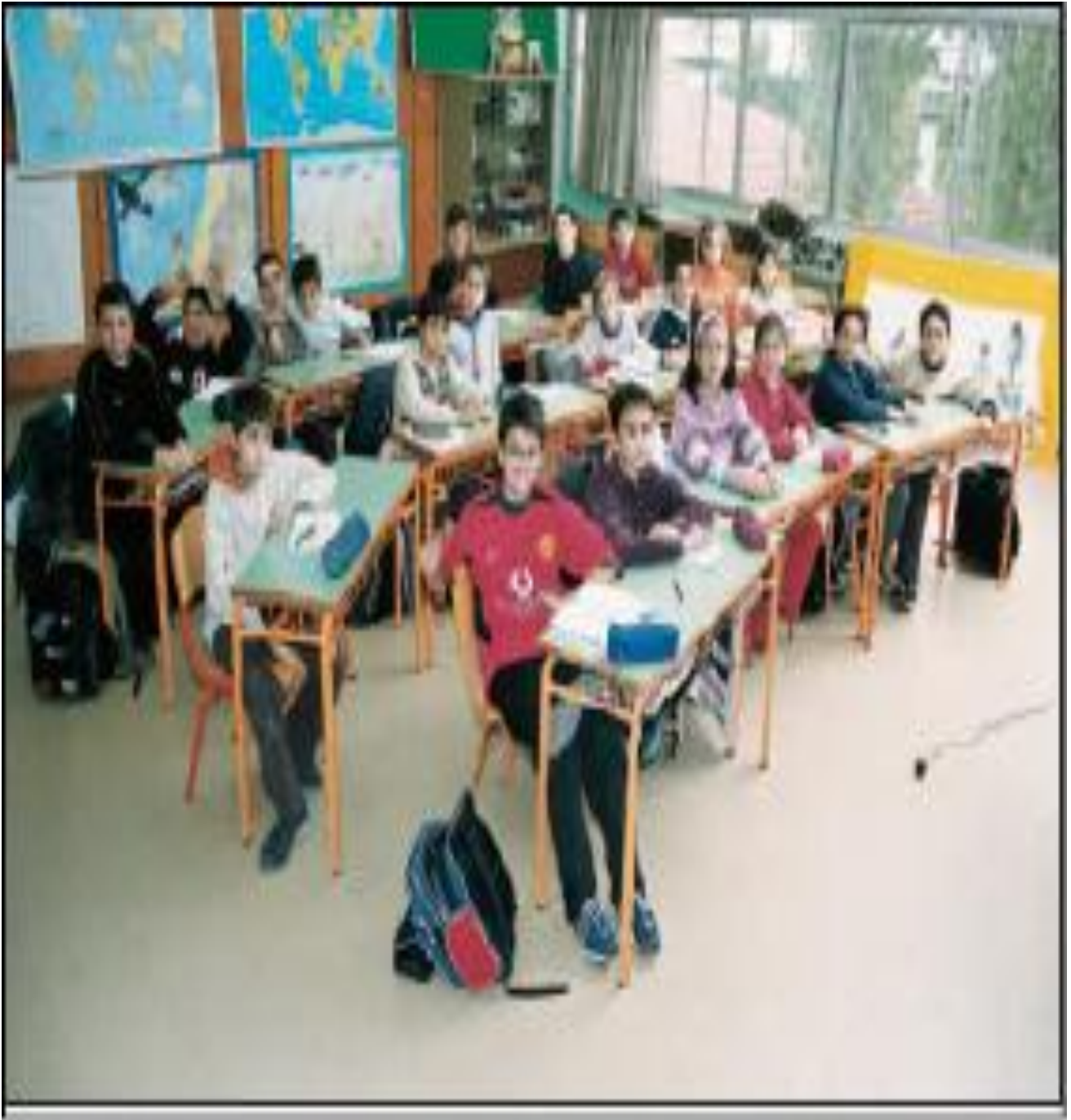
Εικ.5.4β (Φωτογραφικό αρχείο Ε. Κουμάνταρη).