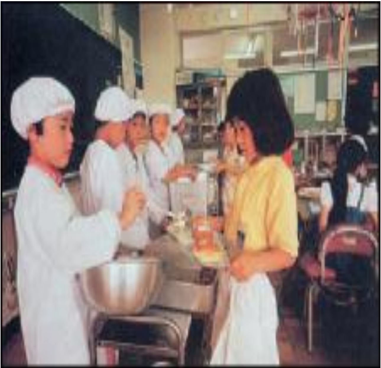
Εικ.5.2 Το ιαπωνικό δημόσιο σχολείο: χώρος εκμάθησης ρόλων (R.T. Schaefer, Sociology, 7th Edition, The McGraw Hill Companies, Inc., 2001).