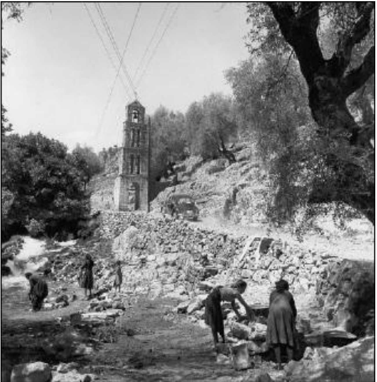
Εικ.4.8 Μπουγάδα στο ποτάμι: αποκλειστική απασχόληση των γυναικών κατά το παρελθόν (R.A. McCabe, Ελλάδα: τα χρόνια της αθωότητας, εκδ. Πατάκη, 2004).