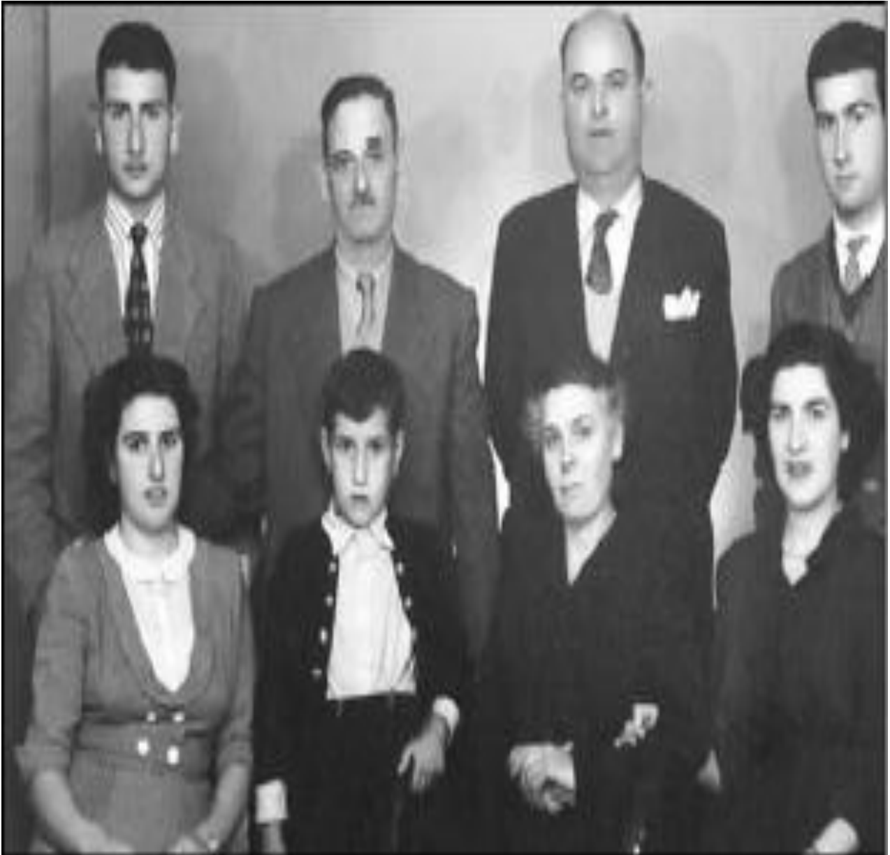
Εικ.4.5α Ελλάδα.