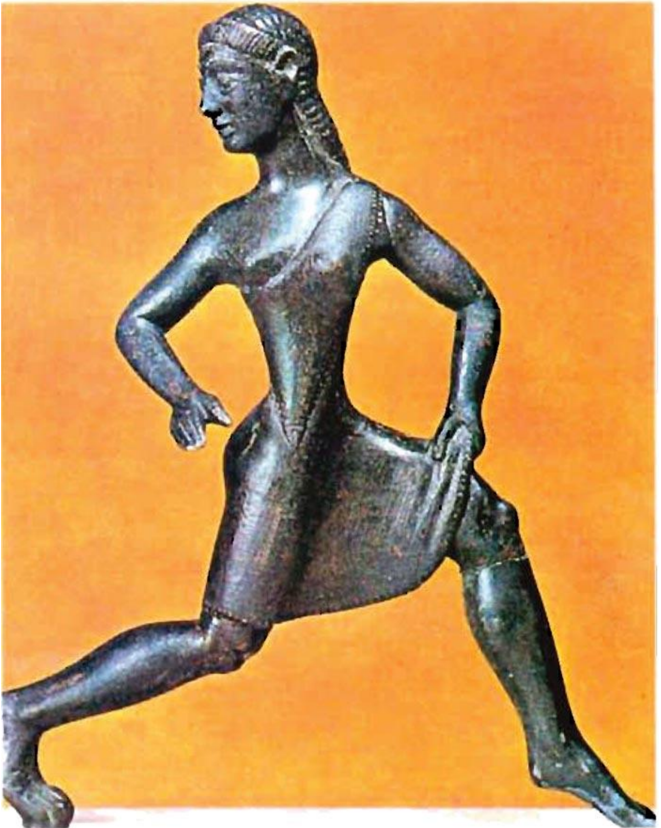
Σπαρτιάτισσα αθλήτρια. Χάλκινο αγαλματίδιο της αρχαϊκής εποχής (Λονδίνο, Βρετανικό Μουσείο).