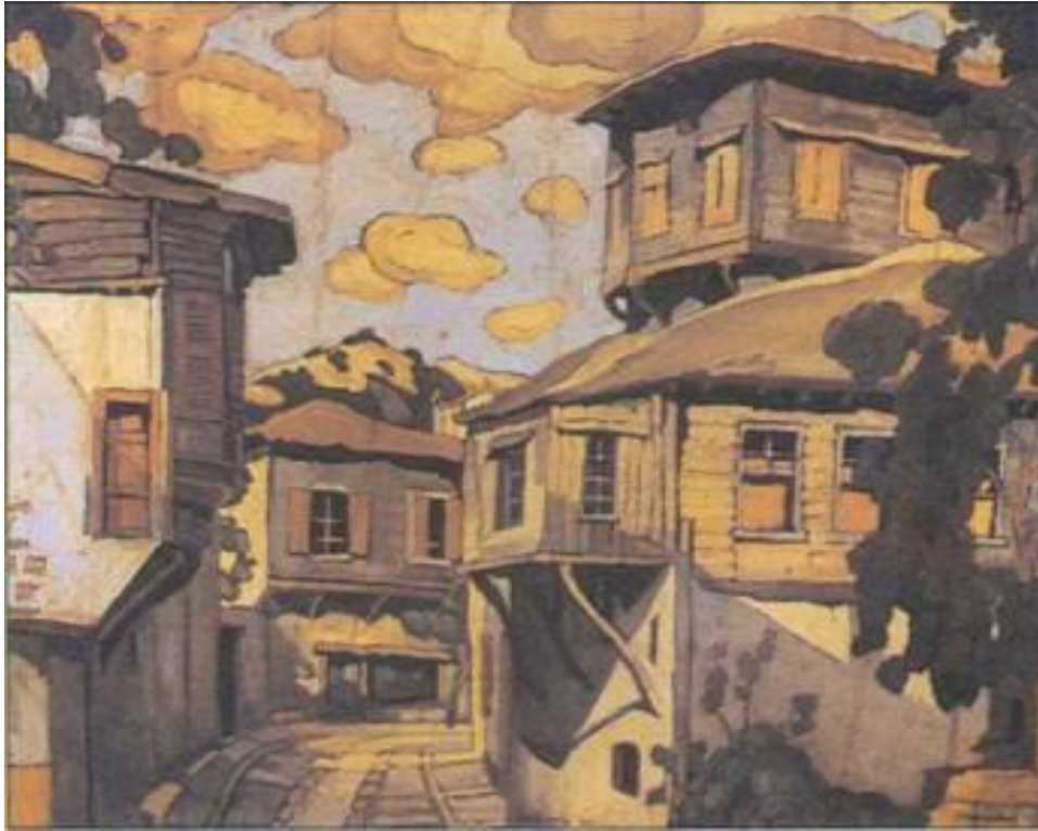
«Αγιάσος» (1925), έργο του Σπύρου Παπαλουκά.