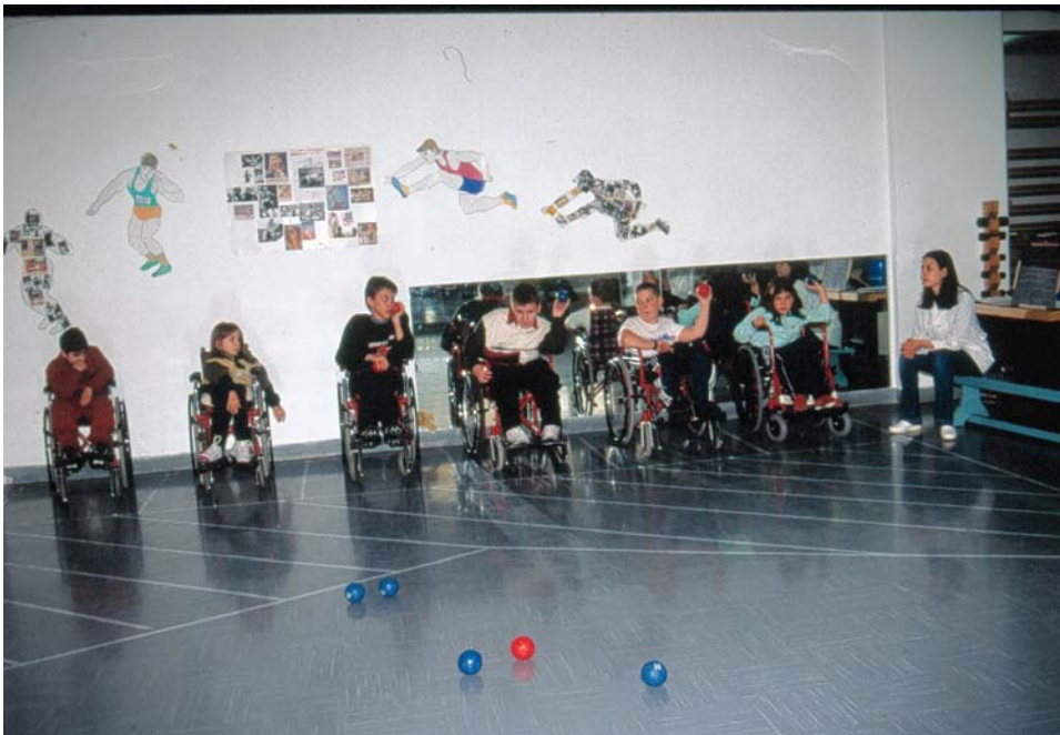
Παιδιά που παίζουν το παιχνίδι Boccia

Η ψυχολογική υποστήριξη και η επαγγελματική αποκατάσταση δεν πρέπει να υποτιμώνται. Άλλη σημαντική ενασχόληση που πολλές φορές μπορεί να αλλάξει την ζωή του παιδιού με κινητικά προβλήματα, είναι η συμμετοχή σε αθλητικές και πολιτιστικές εκδηλώσεις. Οι δραστηριότητες αυτές στα σχολεία δεν πρέπει να υποβαθμίζονται, αλλά αντίθετα χρειάζεται να ενθαρρύνονται και να παροτρύνονται τα παιδιά, γιατί έτσι αναπτύσσεται η ευγενής άμιλλα, η κοινωνικοποίηση, η αλληλοϋποστήριξη, η δημιουργία κινήτρων για διάκριση κ.ά.