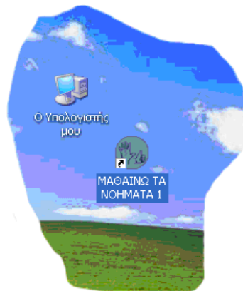
Εικόνα 3: Συντόμευση «Μαθαίνω τα Νοήματα» στην επιφάνεια εργασίας

Για να απεγκαταστήσουμε το λογισμικό εισάγουμε εκ νέου το DVD-ROM στον οδηγό οπτικού δίσκου. Το λογισμικό, διαπιστώνοντας την ύπαρξη αντιγράφου, ρωτά τον χρήστη αν επιθυμεί απεγκατάσταση. Με τη θετική απάντηση του χρήστη, η διαδικασία απεγκατάστασης εκκινεί αυτόματα.